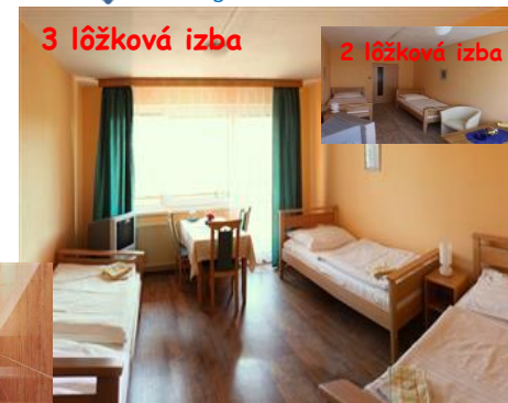
2 lôžková izba

Storno poplatok: mesiac pred nástupom 100 % alebo nájsť za seba náhradu